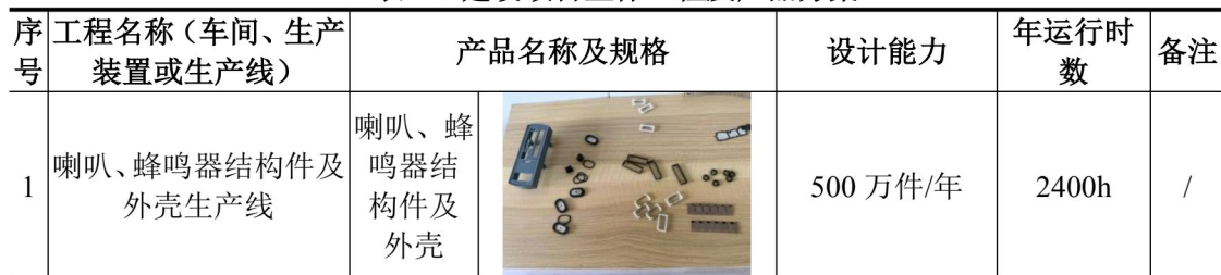
表 2-1 建设项目主体工程及产品方案